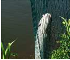
Forelle im Kescher

... i radość jest wielka. Czy aby jednak ryba nie jest zbyt mała, by ją zabrać ze sobą? Sprawdźcie proszę za każdym razem, czy złowiona ryba ma przynajmniej takie rozmiary jak ustalono to w przepisach rybackich (Fischereiordnung) lub ewentualnie też na mapie wędkarskiej. Wybór „minimalnych rozmiarów ryb” znajdziecie w tabeli na odwrocie mapy. Jeżeli ryba jest mniejsza, należy wypuścić ją z powrotem do wody tak, by mogła dalej żyć i się rozwijać. Zwolnijcie więc proszę haczyk ostrożnie albo przetnijcie linkę przy czubku głowy, jeżeli ryba połknęła haczyk zbyt głęboko, i pozwólcie jej szybko odpłynąć.